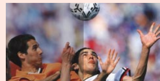
当社従来液晶 ASV方式ピュアクリアン・ブラックTFT液晶

左右、上下に広視野角を実現。 PC XV1 3CEとの比較 「ASV方式ピュアクリアン・ブラックTFT液晶」搭載で テレビやDVDなどの動画をくっきり映し出します。