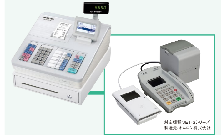
対応機種:JET-Sシリーズ 製造元:オムロン株式会社

●QRコードやバーコード決済には対応しておりません。 ●連動対象の電子決済端末は、接続ケーブルも含めて社外品です。銀聯カード及び対応電子マネーブランド等については加盟店契約先のカード会社によって制約があります。詳しくは、お買い上げ販売店またはシャープレジスタ相談窓口へお問い合わせください。