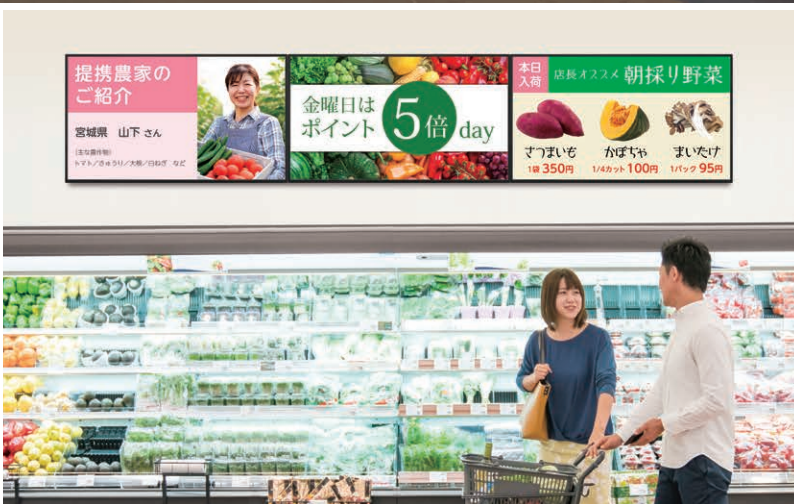
上:PN-M501、PN-M501+フロアスタンド(別売) / 左下:PN-M401 / 右下:PN-M501 設置イメージ