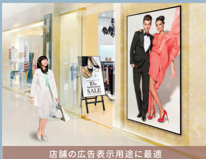
店舗の広告表示用途に最適

制御用のRS-232C端子とLAN端子を搭載。別売のコンテンツ配信・表示システムe-Signage S ® を利用することで、遠隔地からのPC制御も可能です。