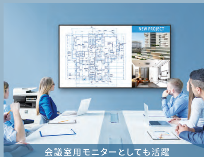
会議室用モニターとしても活躍