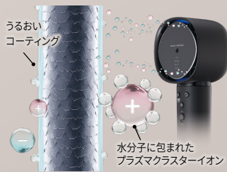
水分子に包まれたプラズマクラスターイオン