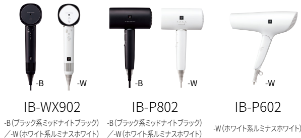
IB-WX902 -B(ブラック系ミッドナイトブラック) /-W(ホワイト系ルミナスホワイト) IB-P802 -B(ブラック系ミッドナイトブラック) /-W(ホワイト系ルミナスホワイト) IB-P602 -W(ホワイト系ルミナスホワイト)