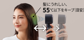
髪にうれしい、 55°C 以下をキープ(目安)

髪との距離をセンシングし、風の温度をコントロール。ドライヤーを近づけても髪が熱くなることを防ぎ、熱ダメージや過乾燥から髪をまもります。(SENSINGモード使用時)