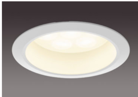
150形 / 半透明パネル