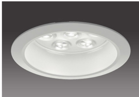
100形 / 透明パネル(表面シボ加工)