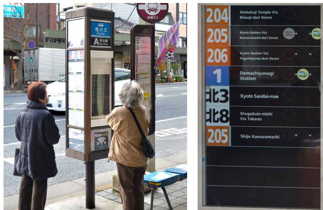
日本語だけでなく英語でもバスの接近案内が表示される