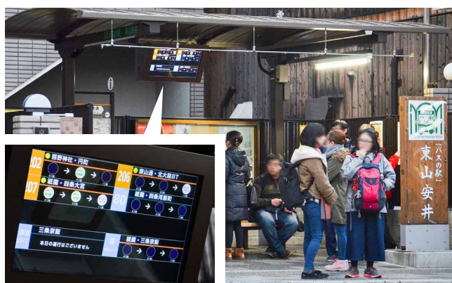
屋根やベンチとともにバス接近案内システムを設置し、「バスの駅」として整備された東山安井停留所

京都市バスではこれまで、停留所でバスの接近を案内するために、反転フラップ式の案内表示器を停留所の標柱に設置して使っていましたが、特注品となるためコストが高く、年間に導入できる台数も限られていました。そこで京都高度技術研究所さまと共同で、バス車両に発信機(ビーコン)を取り付け、そこから発信された信号を停留所で受信して、液晶ディスプレイに接近情報を表示する新たなシステムを開発することになり、ディスプレイの表示内容をコントロールするための制御機器を探していました。