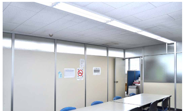
会議室にもLED照明を導入