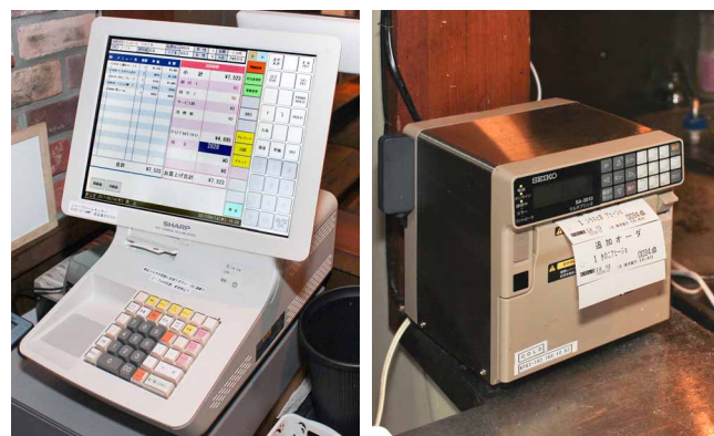
オーダーデータを受信したPOSターミナルはプリンターに印字指示