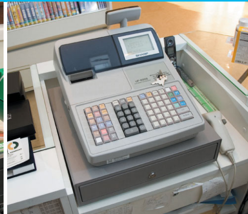
システムレジスタUP-600S