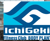
イチゲキプラザビル外観