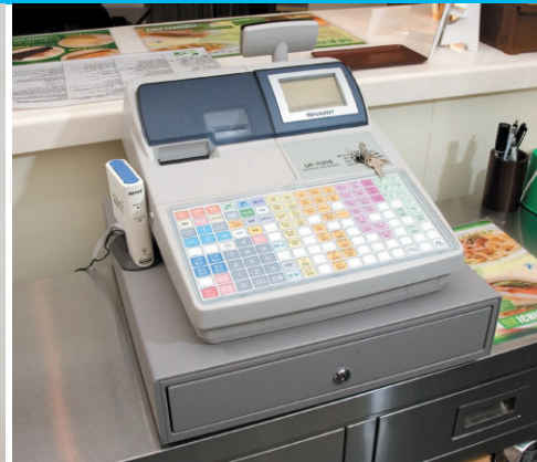
システムレジスタUP-700S (無線LAN付)