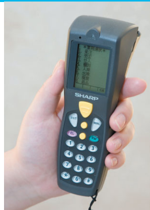
ハンディターミナルRZ-A121

を可能にした。常に単品ごとの在庫管理ができていたので、それにもとづいた商品一つひとつの仕入数量を適正化できる。これまではカンと経験に頼っていた品揃えが、数量データに根拠を置くことで、空手関連はもろろん、フィットネス施設の利用者の需要にも応えていく体制もできそう。商品仕入やオリジナル商品の開発を支える重要なツールとして、ショップのシステムレジスタを活用したこのシステムにかかる期待は大きい。