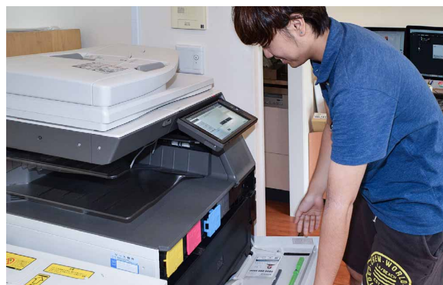
使い終わった青のトナーが自動で押し出され、交換作業を軽減