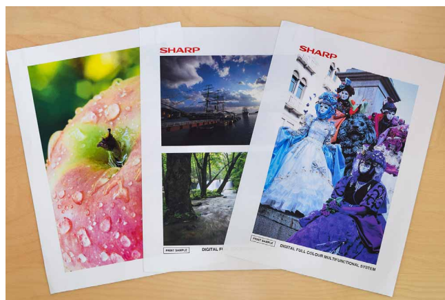
色見本で高画質に納得。採用の大きな決め手に

今回導入した機種は多彩な用紙への出力が可能のため、今後、エンボス紙や名刺などの出力にも利用したいと考えています。またクラウドサービスも活用し、取材先で急ぎよ必要になった資料などをオフィスにいるスタッフに複合機でスキャンしてアップロードしてもらい、出先のモバイル端末に取り込むなど、業務効率化に活用したいと考えています。