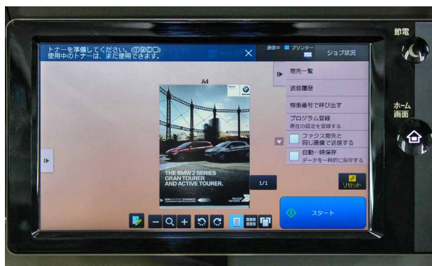
スキャンした画像などをカラー画面でプレビューできる