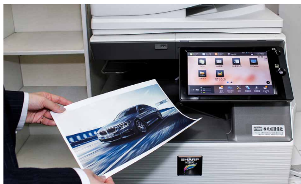
画像などのプリントやコピーもより高画質に