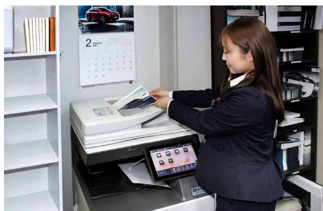
スピーディな起動や低騒音が同社スタッフの皆さまに好評

整備工場で修理の見積りを出す際、外出先でスマートフォンを使って撮った故障車の写真をプリントすることもあります。PCを介さずに直接モバイル端末と連携できる Sharpdesk Mobile が便利で、活用シーンが増えてきました。また、クリアフォルダーにもプリントできる機能を使って、お客さまの名前と選ばれたクルマの写真が載ったオリジナルのクリアフォルダーを作成し、営業ツールとして役立てていきたいと考えています。