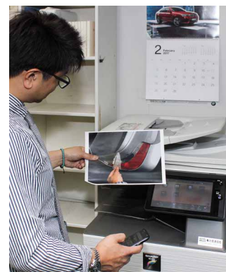
無線LANでスマートフォンの写真を直接印刷できるため、営業担当が撮った事故車の写真などを整備工場へ回す作業が効率化