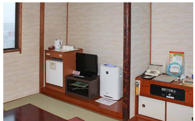
和室にもしっかりとなじむシンプルで落ち着いたデザインも評価