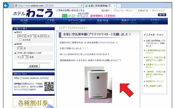
ホームページのインフォメーションコーナーでも全室完備をアピール