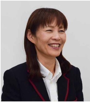
株式会社モノリス