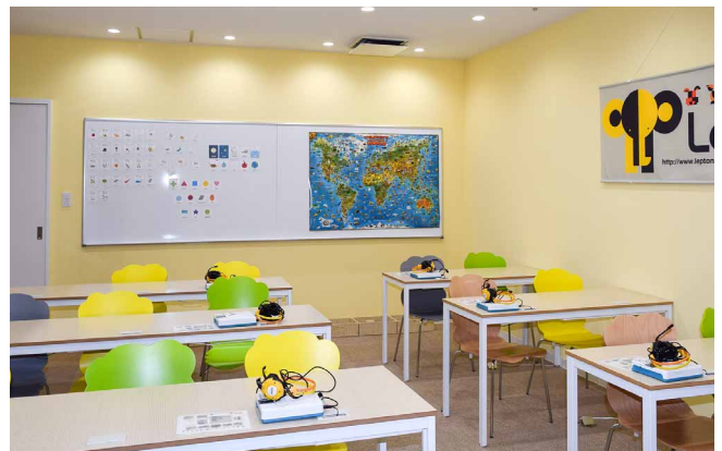
併設されている英語教室にも設置