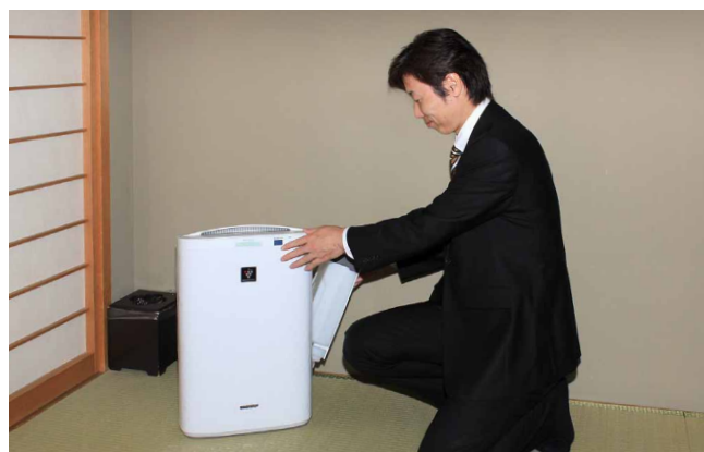
給水タンクはワンタッチで取り出せ、水の補給が簡単