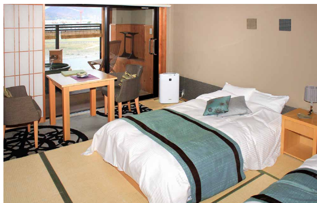
和ベッドの部屋 露天風呂付き