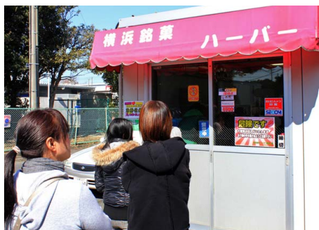
工場内の直販店には平日でも多くのお客さまが並ばれる