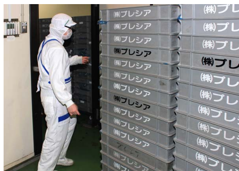
半製品の一時保管室内にも設置されている