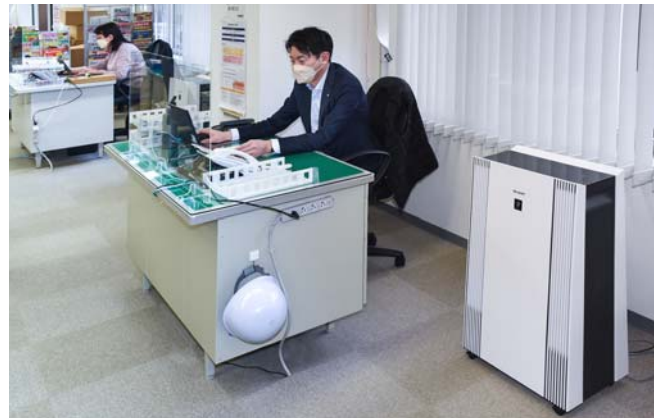
運転音が気にならず、快適に利用できる