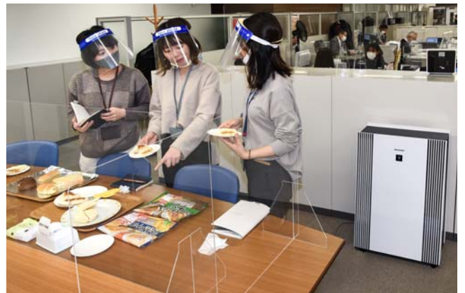
商品の試食などで食べ物のニオイがこもるのを抑制

業務時間中、常に運転させていますが、空気浄化、脱臭、静電気除去で大きな効果を実感しています。プラズマクラスターを先行導入した東北の2工場、埼玉県の商品開発部でも非常に高い評価を得ており、今後さらに都内の事業所や全国の生産拠点にも導入を検討していきたいと考えています。