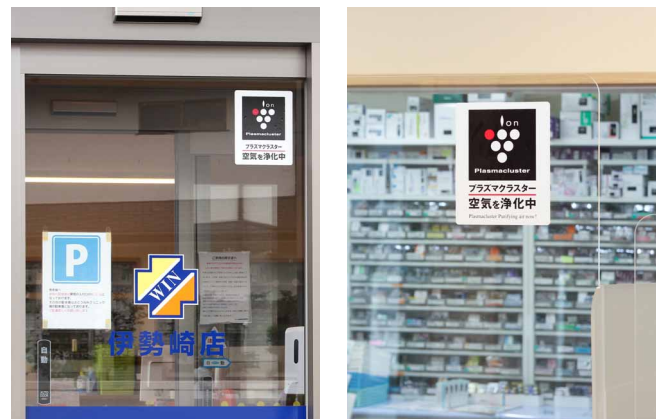
入口や窓口にステッカーを貼ってプラズマクラスター導入をアピール