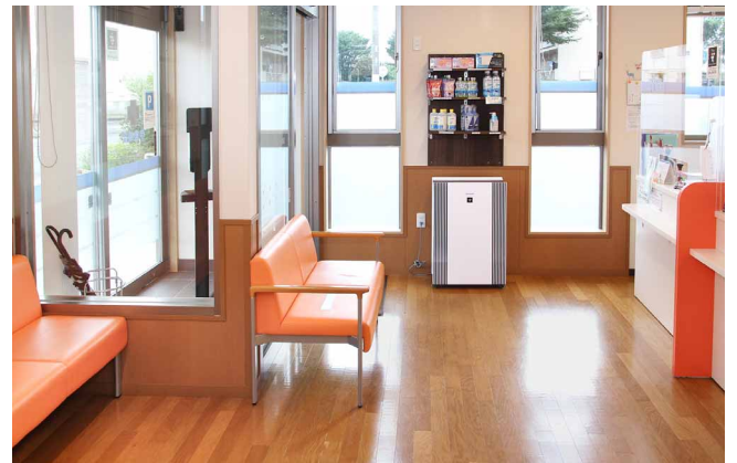
広い待合室に大型の空気清浄機 (FU-M1400) を設置

グループの調剤薬局でまだ設置していない店舗から、当店の空気清浄機設置が評価されており、今後グループ内でさらに導入が広がっていく可能性があります。新型コロナウイルスが気になって外出が不安な方も多い状況ですが、対策の徹底で引き続き患者さまから選んでいただける調剤薬局を目指します。