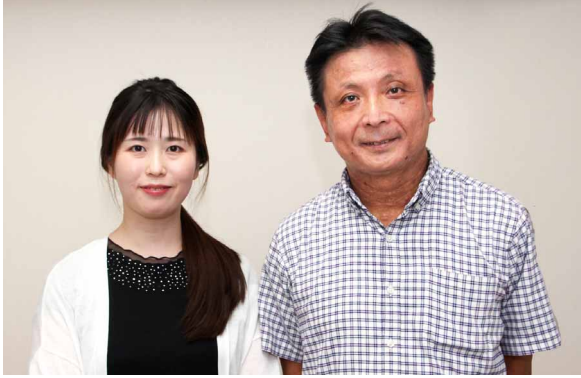
ウイン調剤薬局 伊勢崎店