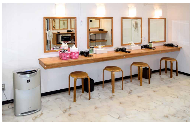
パウダールームには業務用加湿空気清浄機も採用