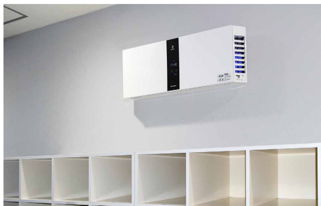
壁掛け型の採用で、ロッカーの上に省スペースに設置