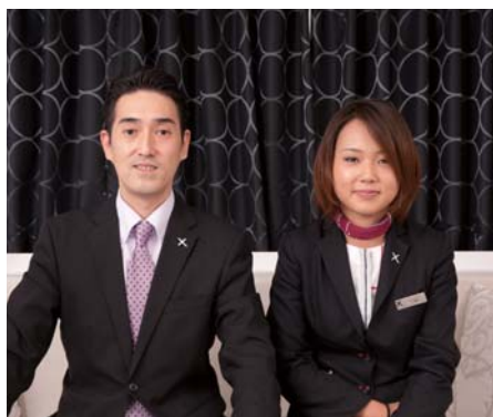
クロスホテル大阪