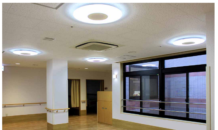
中庭を設け、採光にこだわったデイルームも一層明るく