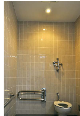
落ち着いた空間を演出するため、 トイレには電球色相当を採用

会場で従来の蛍光灯との消費電力の比較、ランニングコスト面でのメリットの説明を受けたほか、実物の明るさや直接触れて熱を持たない特長などを肌で確認できたことは、大きな決め手になりました。また、あらゆる導入箇所に対応する豊富なラインアップがあり、導入がスムーズに運びました。