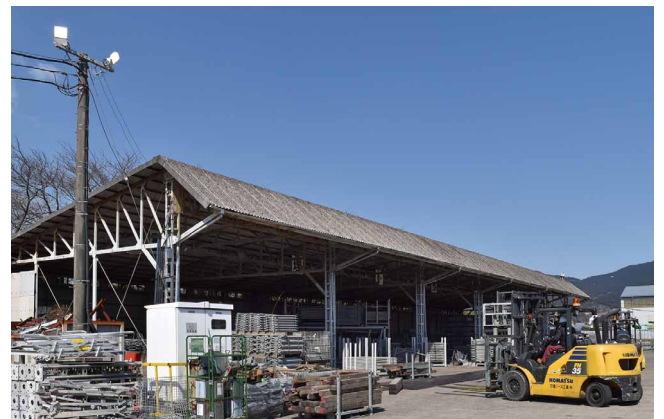
屋外作業場へのLED投光器設置で、作業の安全性もアップ