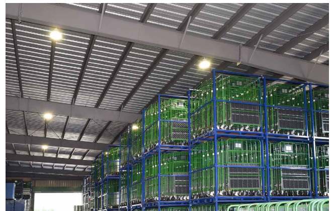
高天井照明で高所から明るく照らすことができ、ランプ交換も大幅減

LED照明で電気代を削減できたことから、今後も残りの蛍光灯等の置き換えを順次進めていく計画です。従業員がより明るく快適な作業のもとで働ける環境づくりをさらに進めていきたいと考えています。