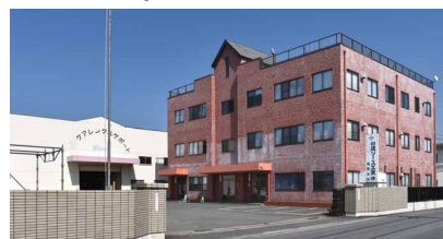
福岡工場(本物件) / 福岡県粕屋郡宇美町