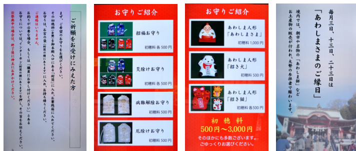
ディスプレイでお守りの種類や季節の行事などを紹介

また、当宮では季節ごとに年間15回の祭事があり、参拝に来られた方への情報提供にもっと力を入れたいと思っていました。