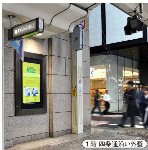
1階 四条通沿い外壁