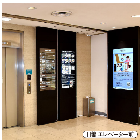
1階 エレベーター前