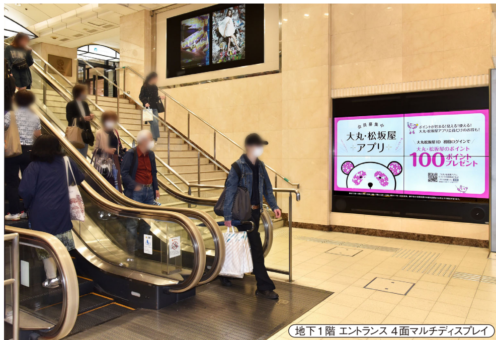
地下1階 エントランス 4面マルチディスプレイ