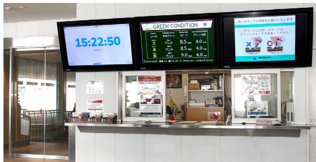
半屋外のマスター室前は防水筐体(ディスプレイシールド)で設置