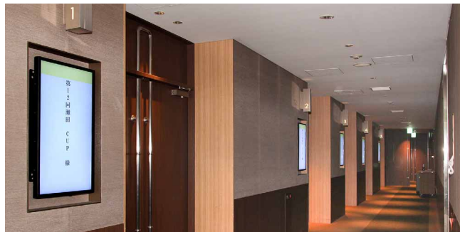
コンペルーム前の案内表示。急な変更にもすぐに対応できる

先に導入していたデジタルサイネージは、ディスプレイ本体と表示・配信システムが別会社だったため、不具合時の修理対応など、保守サポートの連携に課題を感じていました。また、コンテンツ更新などの運用面でも自由度が小さく、機器の老朽化をきっかけに、表示・配信システムを含めた入れ替えを検討しました。