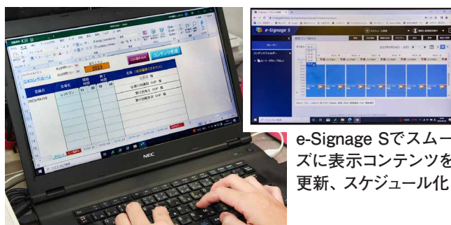
e-Signage Sでスムーズに表示コンテンツを更新、スケジュール化