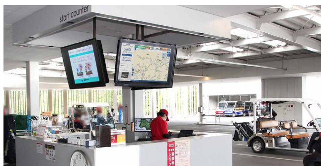
スタートカウンターの天吊り設置も防水筐体で風雨による故障を防止