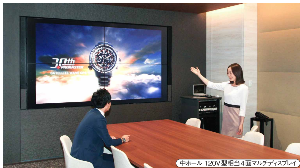
中ホール 120V型相当4面マルチディスプレイ