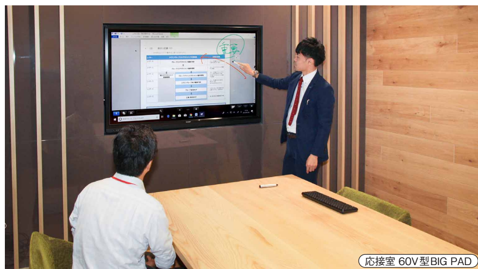
応接室 60V型BIG PAD