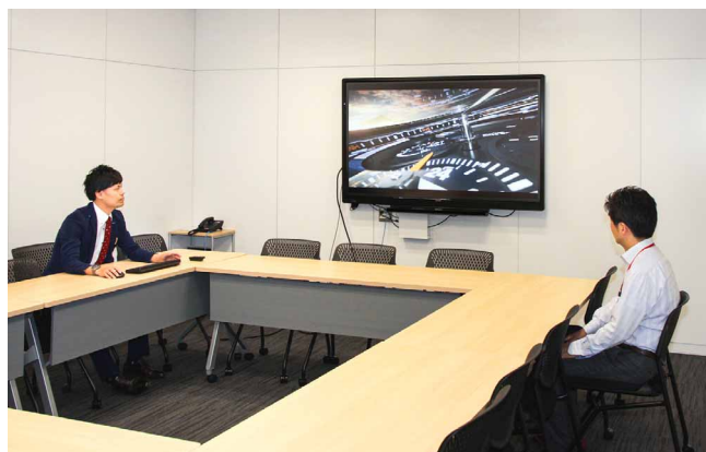
ミーティングルームのBIG PADで社内コミュニケーションが活性化