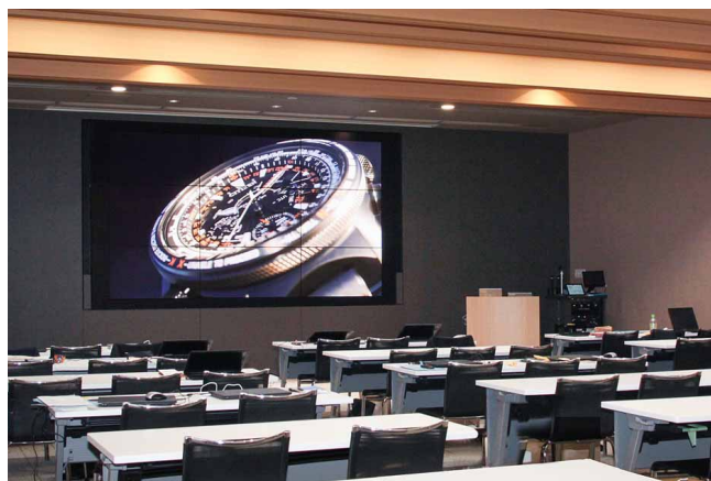
先進性を印象づける大ホールの180V型相当9面マルチディスプレイ

当社100周年事業の一環として受付・レセプションスペースのリニューアルを進めるなか、ホールや応接室では、お迎えしたお客さまとの対話が深まり、次の100年に向けて新しい発想が生まれるような空間にしたいと考えました。そこで着目したのが先進のディスプレイ機器でした。お客さまとの打ち合わせをはじめ、会議、講習会等で映像を活用することで、コミュニケーションの質が高まり、プレゼンの説得力が増す効果を期待しました。