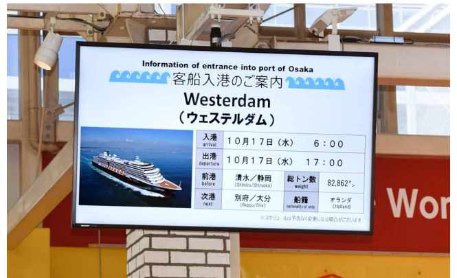
大型客船の入港など、ビレッジ内のあらゆる情報を発信