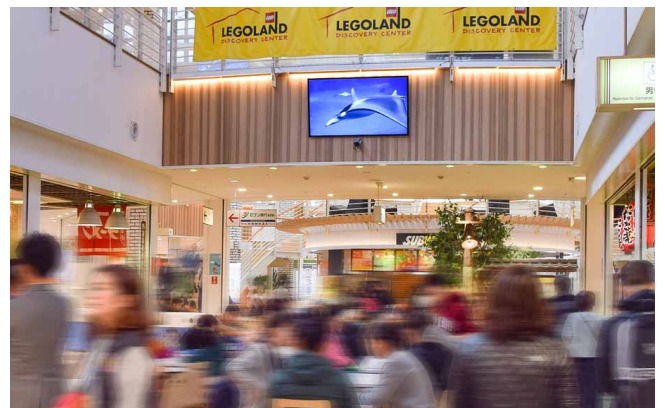
海遊館のPR映像やイベント映像などを表示してサービス向上

今後は次回のイベントの案内や海遊館の特別企画展の告知などにも活用する予定で、こうした情報も英語、中国語、韓国語などで多言語表示することで、外国人観光客への情報発信の強化にも役立てていきたいと考えています。