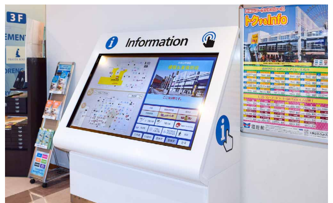
60V型BIG PADのフロア案内は多言語表示に対応