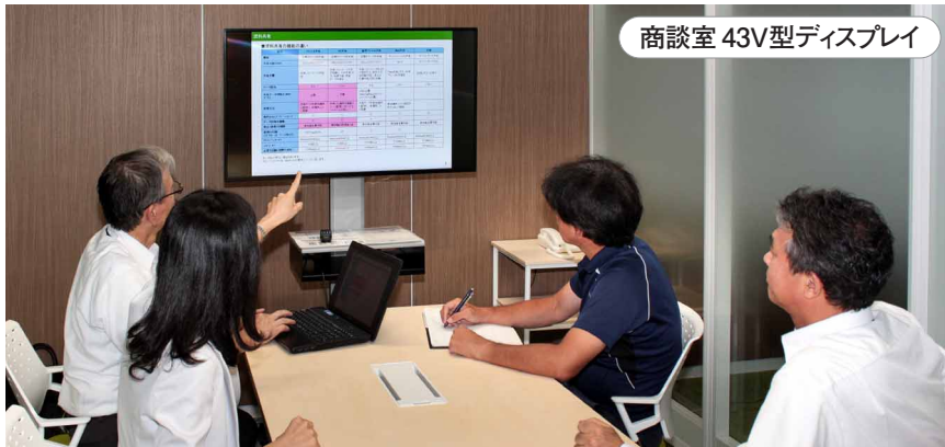
商談室 43V型ディスプレイ