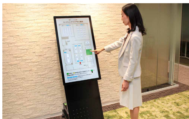
使用する商談室をタッチ → 「使用中」を表すグリーンが点灯 (インタラクティブコンテンツ制作ソフト ゆう子でタッチで制作)

部屋の使用状況をワンタッチで表示できる案内ディスプレイなど、今回導入したシステムは社内外から評価が高く、当社のお客さまへの導入提案も行っています。また、エントランスの4面マルチで発信しているコンテンツはクラウドで管理しているので、今後、東海エリアの他の支店でも配信・表示したいと考えています。