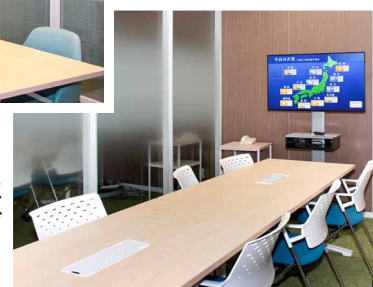
(右) お待ちいただく時間にエントランスと同じ映像をご覧いただくことも