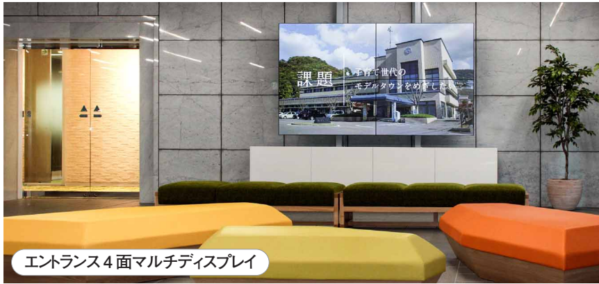
エントランス4面マルチディスプレイ