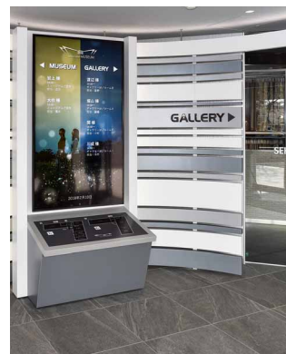
エントランスのウェルカムボードでご予約客のお名前を表示