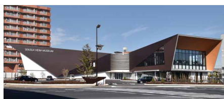
セキスイハイムミュージアム(本物件)