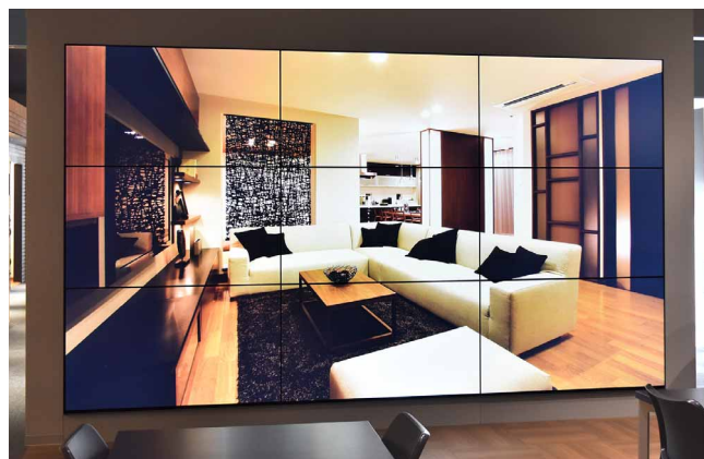
原寸大に近いスケール感で表示でき、住まいの雰囲気を実感できる

現在16箇所の住宅展示場を展開している当社では、それぞれ約4年毎に更新を行っています。今後は、時期を迎えた施設から順にデジタルサイネージの導入を行い、お客さまにより分かりやすく内容を伝えられる展示演出を拡充していきたいと考えています。