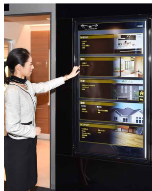
タッチ操作でお客さまに合わせて商品紹介映像を表示