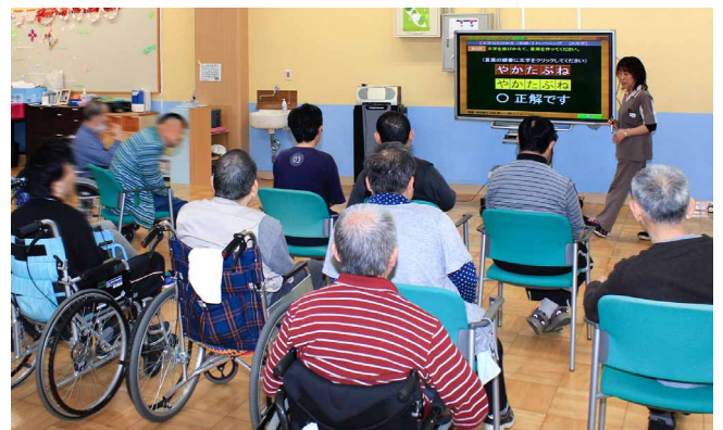
大画面だから大勢の利用者が一度にトレーニングに参加できる