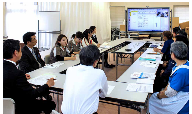
相手の表情やパソコンに取り込んだデータを同時に見ながら活発に話し合いが進むWeb会議

また、福祉葬祭事業での活用計画も進めており、入院中などで葬儀に参列できない方に、タブレット端末等からWeb会議システムを使って、葬儀会場へ弔辞などをいただく“Web参列”のサービスも検討中です。