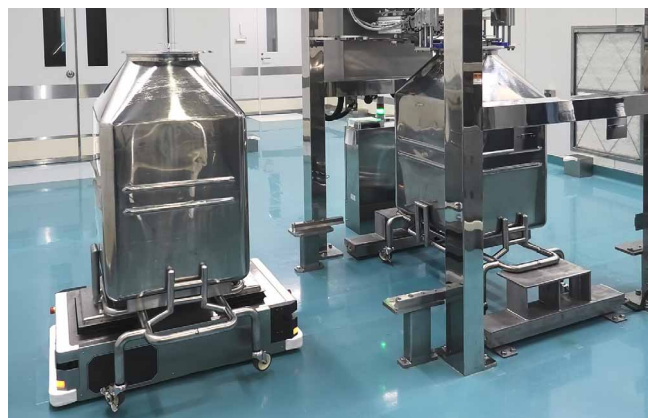
顆粒の容器充填工程でAGVが繰り返し容器を交換して自動搬送

漢方薬のエキス顆粒製造工程の一つを担う造粒室では、エキス顆粒を専用容器に充填しては次の工程に運び出す作業を反復して行っています。充填すると175kgにもなる容器を人がキャスターで運搬するのは体の負担が大きく、安全にも気を遣います。また、容器の交換・運搬は20分に1度のペースで繰り返し行う必要があるため、負担率が高い工程となっており、生産効率を上げるうえでも機械化・自動化に取り組みたいと考えました。