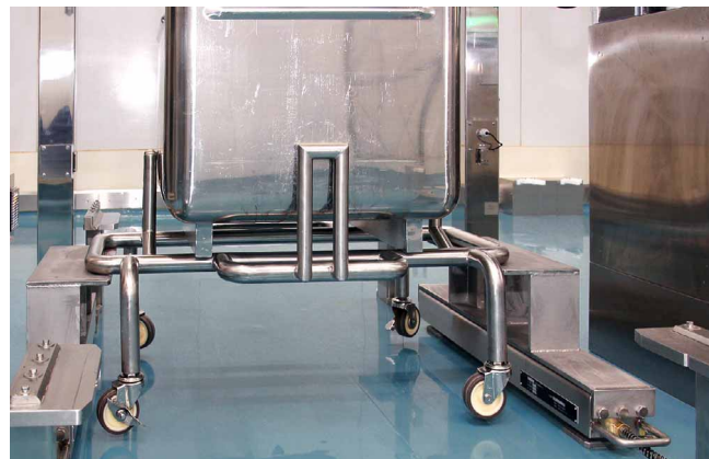
自動重量測定にパー型スケールを採用したことで清掃性がアップ